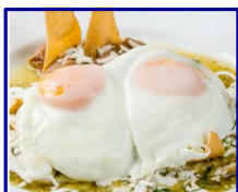
Chilaquiles con huevo