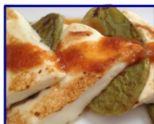
Nopal asado con queso